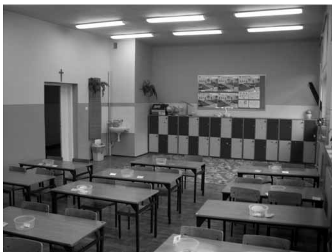
Jedna z sal lekcyjnych pięknie odnowiona.

W swoim wystąpieniu dyrektor przypomniała o wydarzeniach historycznych, bezpośrednio związanych z wybuchem II wojny światowej. Symbolem tej tragicznej przeszłości jest pomnik w Piotrowicach postawiony ku czci mieszkańców Piotrowic, którzy zginęli na polach bitewnych I i II wojny światowej.