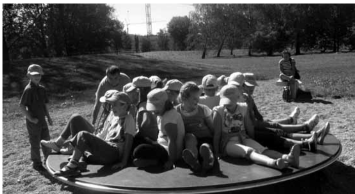
Dzieci na Karuzeli Fizyka.

28 sierpnia odbyła się wycieczka do Ogrodu Doświadczeń w Krakowie. Wychowankowie Świetlicy Profilaktyczno-Wychowawczej w Preciszowie (31 osób) mieli okazję aktywnie spędzić czas, łącząc zabawę z edukacją.