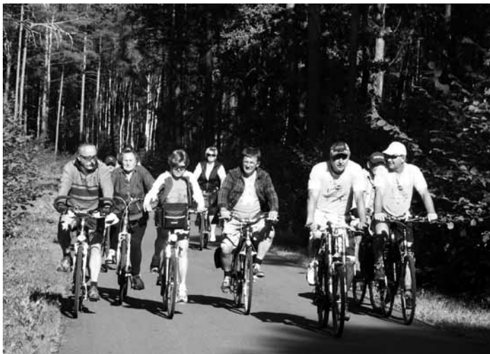
Cykliści na drogach Podkarpacia.

W dniach od 5 do 9 września wyjechaliśmy wczesnym rankiem pociągiem z Przeciszowa przez Kraków do Rzeszowa na pięciodniowy rajd rowerowy po województwie podkarpackim. W pierwszym dniu przy pięknej pogodzie zwiedziliśmy na rowerach Rzeszów, zabytkową studnię znajdującą się w centrum staromiejskiego średniowiecznego rynku oraz podziemia rzeszowskiego rynku, który jest systemem korytarzy i komór, usytuowany na głębokości do 10 metrów. Piwnice te pełniły w